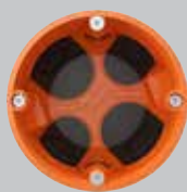
Orange ECON® Rohr-Geräte- Verbindungsdose

Großes Volumen ermöglicht komfortables Verdrahten.