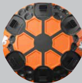
Orange ECON® Verbindungsdose Ø 120 mm